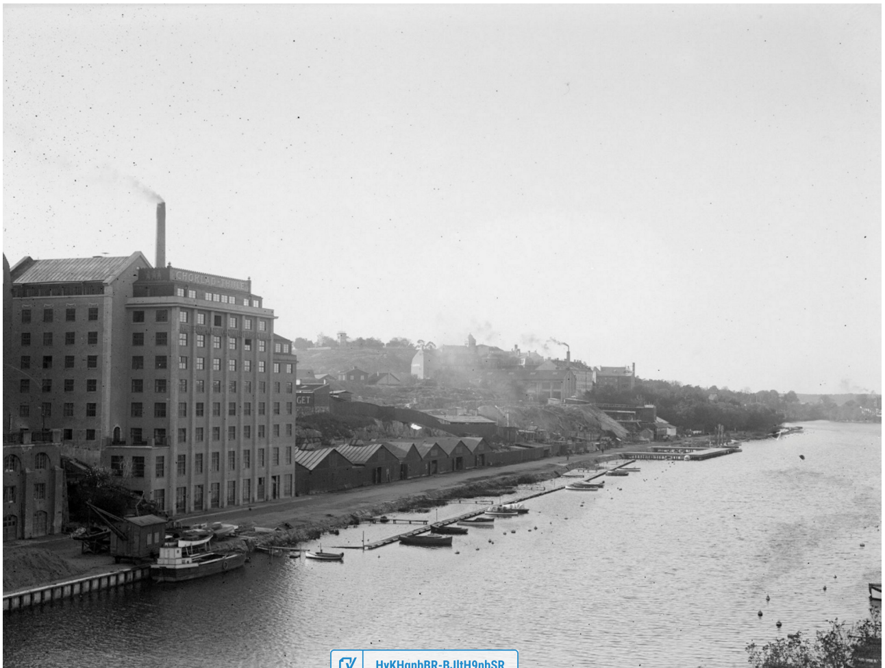
Kungsholms strand västerut från Sankt Eriksbron. Till vänster Choklad-Thules, eller AB Förenade Chokladfabrikernas, stora fabriksbyggnad. I fonden Stadshagen där Vattentornet skymtar. 1930.